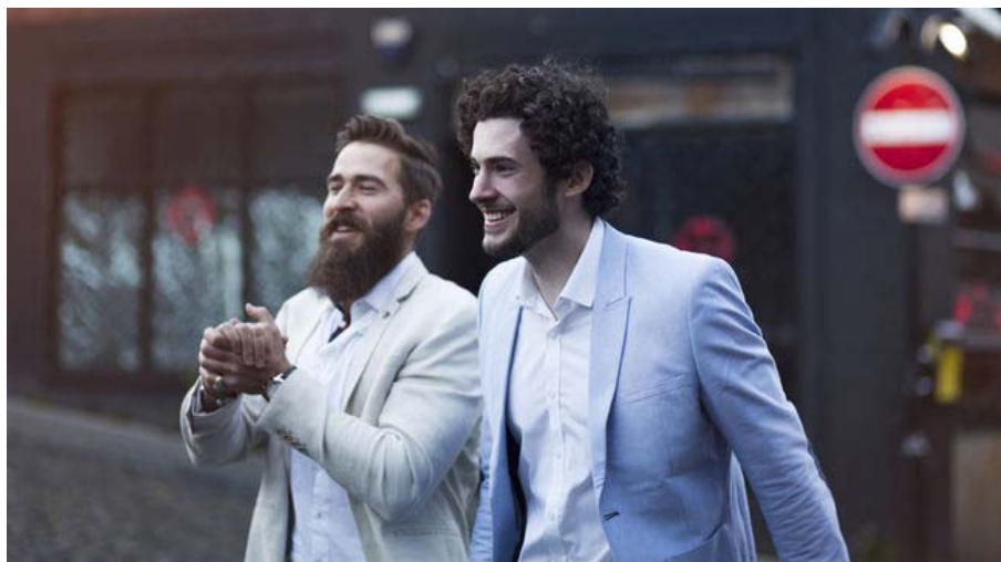
Gewinnen Sie einen Shopping-Gutschein